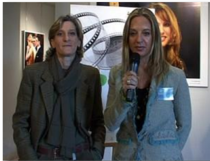
Festival del Cinema Irlandese